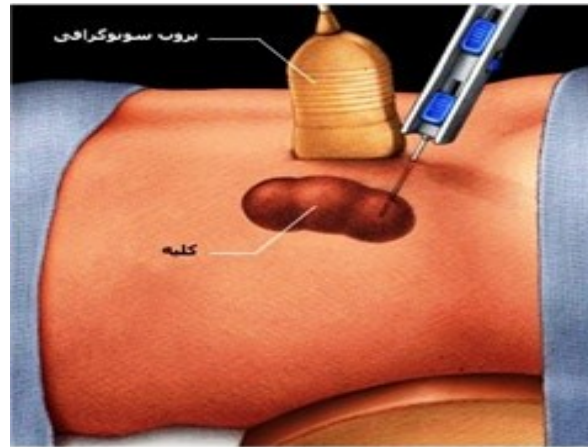
تصویر ۱: نمونه برداری کلیه به روش بسته

در حالی که از طریق سونوگرافی کلیه رامی بینند با یک سوزن که از پوست وارد می شود از بافت کلیه نمونه برداری می کنند.